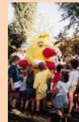
Kněževská chmelová šiška