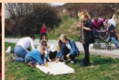
„Pochod pro kuřátko“ Klub nemocných cystickou fibrosou