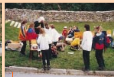
Sportovní akce Sananimu Olomouc