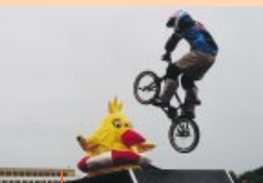
z akcí pořádaných Prague International Marathon