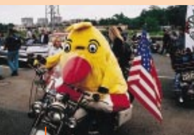
sbírkové akce pokračují: setkání Harley Davidson, 4. ročník sbírky