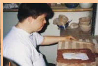
Spolek Josefa Šímy, Brno