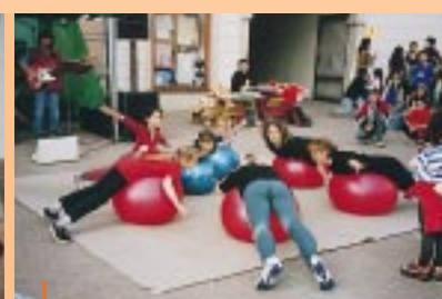
Sdružení Piafa, Vyškov