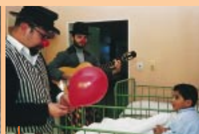
Sdružení Telepace, Ostrava